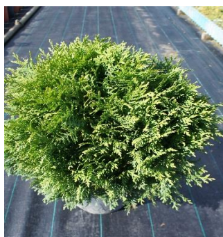
Thuja Tiny Tim (Bola)