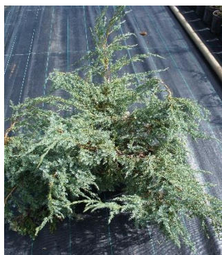
Juniperus Pfitzeriana Glauca