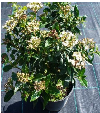
Vivurnun tinus Eve-Price