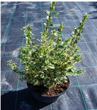
Buxus Sempervirens Aureovariegata