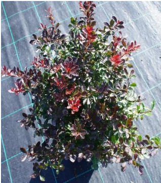
Berberis Thunbergii "Atropurpurea Nan"