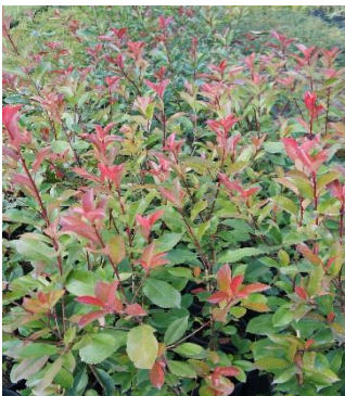
Photinia Fraseri Red Robin