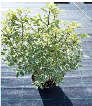
Pittosporum Tenuifolium "Variegata"