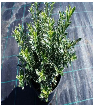
Euonymus Japonicus Aureomarginatus