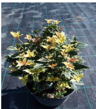
Osmanthus Heterophylus Goshiki