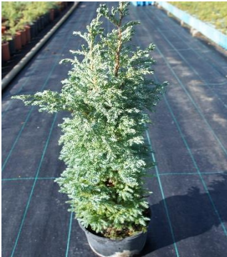
Chamaecyparis Law. Boulevard