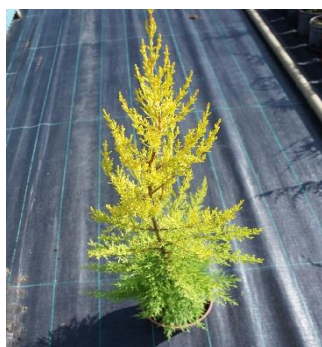
Cupressus Macrocarpa Gold Crest