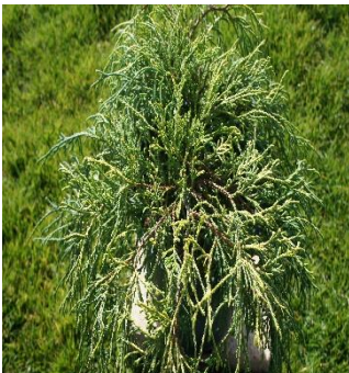
Chamaecyparis Law. Pisifera Sungold