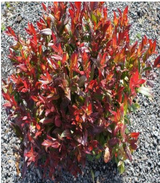
Nandina Domestica Pigmaea