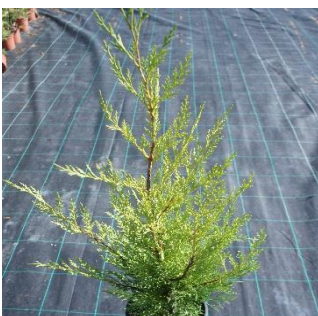
Cupressocyparis Leylandi Matizado