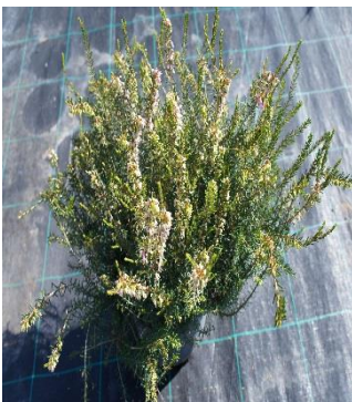
Erica Darleyensis Darley