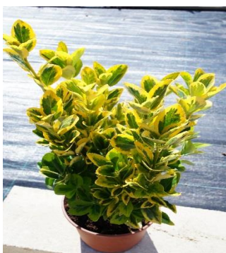
Euonymus Japonicus "Aureus"