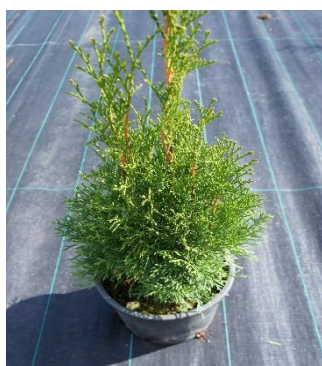
Thuja Occidentalis Esmeralda